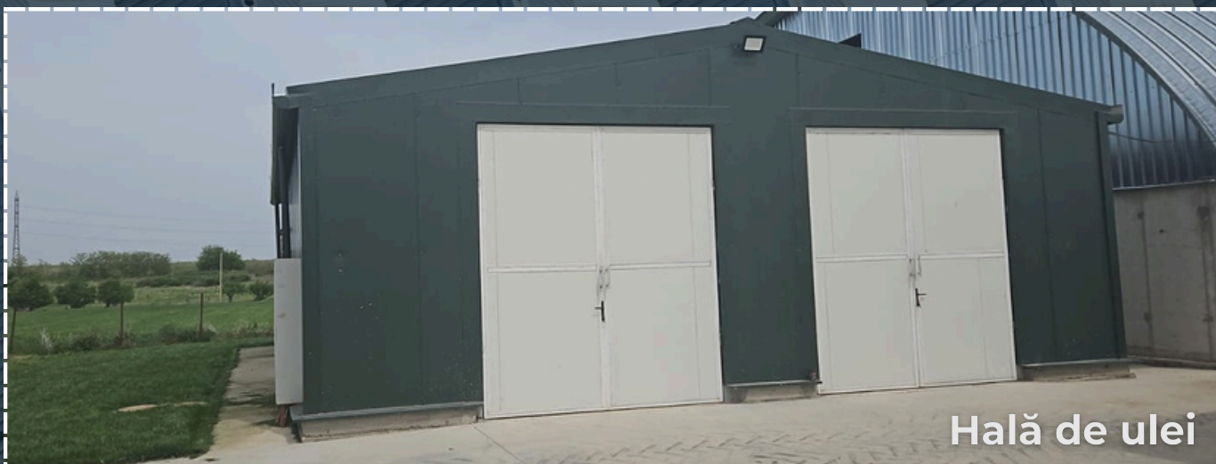
Hală de ulei